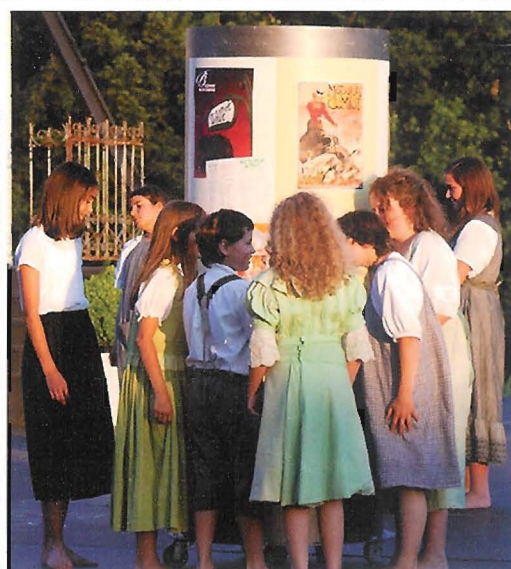
Szenen aus der Operette «Die lustige Wittwe», die gegenwärtig auf der Freilichtbühne in Burgäschi aufgeführt wird.